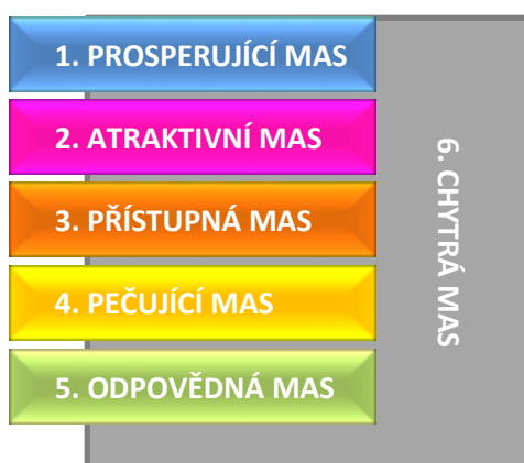
Obrázek 3 - Schéma strategických cílů a inovativní rysy SCLLD

Sama SCLLD si potom klade za cíl podporovat inovativní aktivity, které povedou k vyváženému rozvoji regionu v mnoha oblastech. Jedná se o podporu inovací jak technických, produktových, procesních, sociálních, tak organizačních tak marketingových. Jednoznačný pohled udává zaměření opatření specifického cíle 6.1 Chytrá řešení. MAS má ambice být nositelem role tzv. inovačního brokera ve svém zájmovém území.